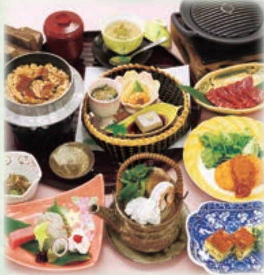
写真は、黒毛和牛鉄板焼 あじさい 6,000円です。