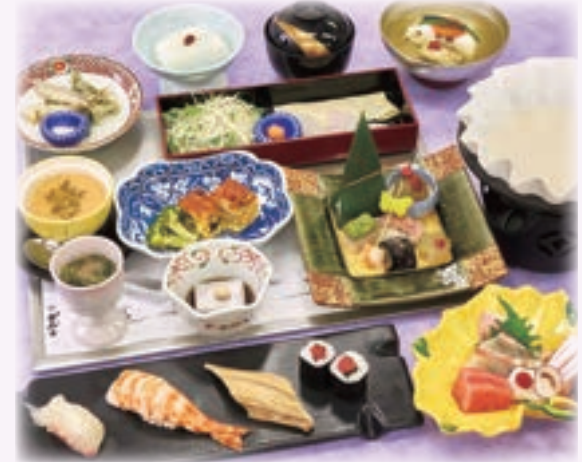
写真は、なんぜん 南禅 8,500円です。