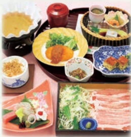
写真は、豚しゃぶ小鍋 あやめ 3,500円です。