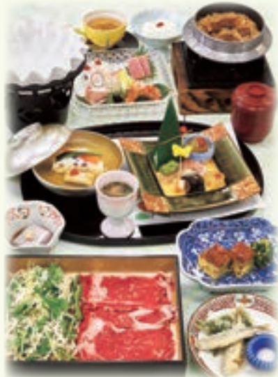
写真は、牛しゃぶかつら 季節釜飯に変更 8,500円です。