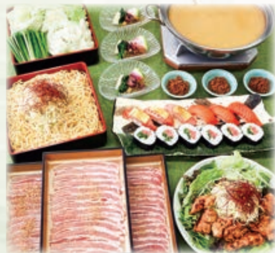
写真は、ごま担々鍋コース 4,500円です。(写真は3人前)