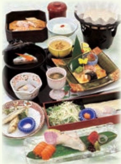
写真は、魚しゃぶかえで 5,500円です。