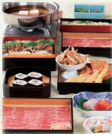
写真は、つゆ豚しゃぶ 若紫 4,000円です。 (揚物盛・つゆ豚しゃぶ・うどん・ねぎとろ巻は2人前)