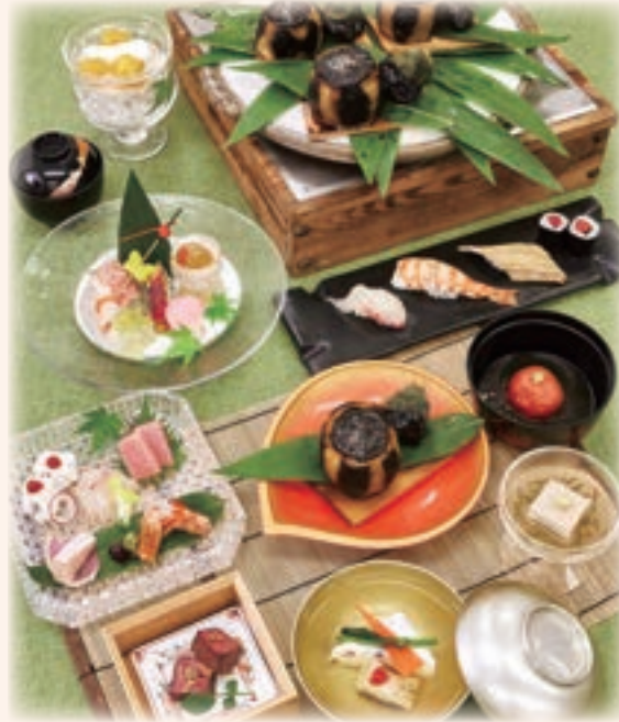
写真は、つばき 10,500円です。