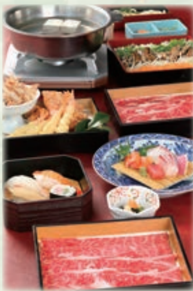
写真は、近江牛しゃぶ 紫紺 7,000円です。 (揚物盛・近江牛しゃぶ・うどんは2人前)