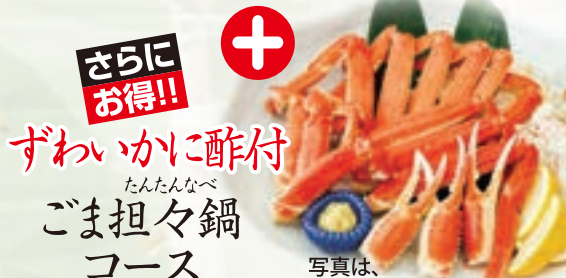
写真は、ずわいかに酢3人前です。