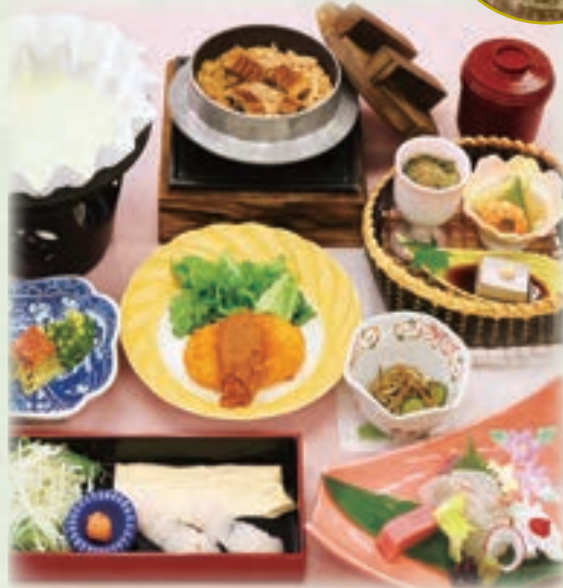
写真は、魚しゃぶ小鍋 うつぎ 4,500円です。